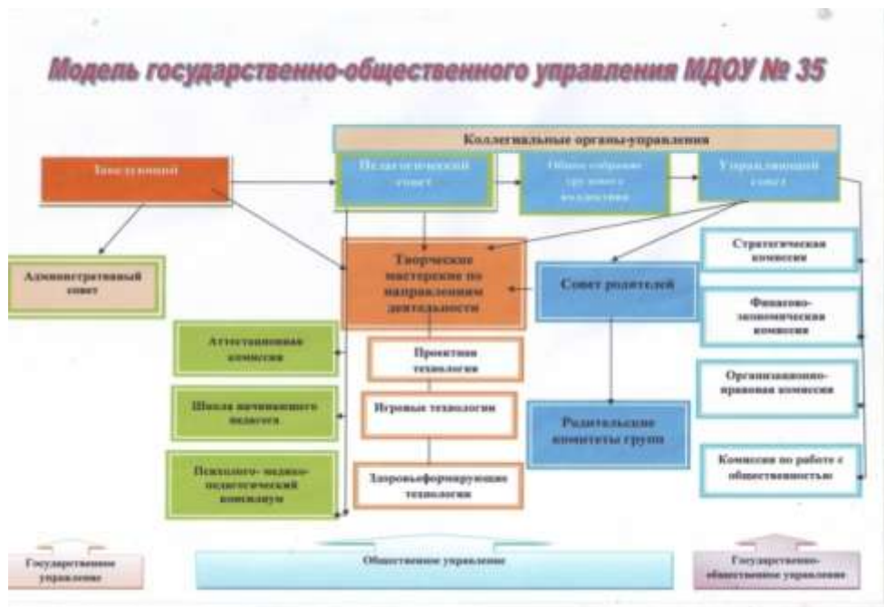
Таблица 2. Управленческий аппарат сформирован, распределены функциональные обязанности между членами администрации.

Деятельность коллегиальных органов регламентируется Уставом "Учреждения", положениями о них и другими локальными актами. С положениями можно ознакомиться на сайте дошкольного учреждения на странице "Документы".